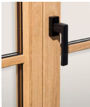
Der Toulon Griff - schwarz matt lackiert

Eloxalbeschichtete Alu-Abdeckprofileiste (silbern, bronze) im unteren Blendrahmen- und Flügelbereich