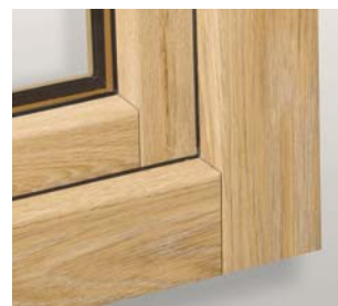
Verbindungen der Rahmen- und Flügelprofile in einem Winkel von 90° von der Außenseite